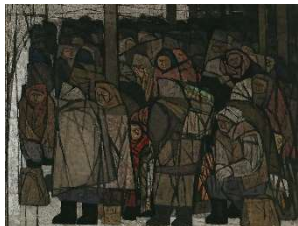
小島丹漾《待つ》1965年 〔「雪国を描く一栢森義・小島丹漾・富岡惣一郎 三人展—」より〕

展示室1 雪国をえがく一栢森義・小島丹漾・富岡惣一郎 三人展— 展示室2 幻想世界 シュルレアリスムと美術 展示室3 近代美術館の名品