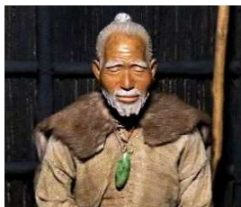
ヒスイの大珠(たいしゅ) (大きなアクセサリ)をつけた縄文人

期日 ：開催中～2/5(日) 休館日 ：毎週月曜日(祝日の場合は翌平日)、年末年始(12/28～1/3) 開館時間 ：9:00～17:00(観覧券の販売は16:30まで) 会場 ：常設展示「縄文文化を探る」内 観覧料 ：常設展観覧料(一般520円、高大生200円、中学生以下無料)