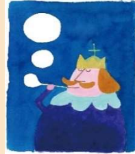
『ぼくは王さま』(文・寺村輝夫)表紙 1967 理論社 多摩美術大学アートアーカイブセンター蔵 ©Wada Makoto