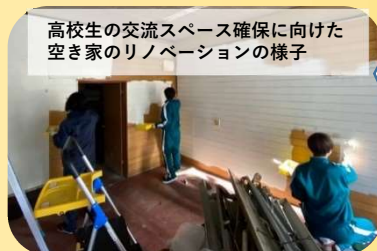
高校生の交流スペース確保に向けた 空き家のリノベーションの様子

ネットワーク校の生徒同士が、 対面やオンラインで、探究学習 の成果を合同で発表する機会を 設けています。