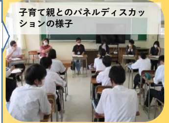
子育て親とのパネルディスカッ ションの様子

地域の魅力発 信や課題解決 に向けた実践 的活動を、地 域の方々と一 緒に行ってい ます。