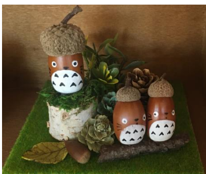
【ドングリDEトトロ森作り】